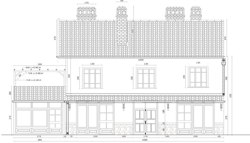
Çizim 3. Güney Cephesi (KUDEB)