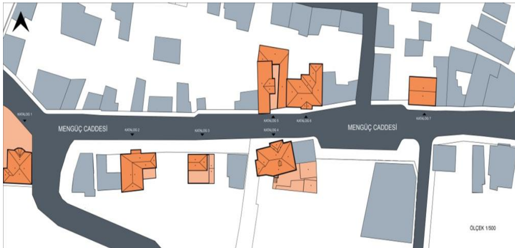
Şekil 1. Mengüç Caddesindeki İşlevi Değişen Geleneksel Konutlar (Edibe Begüm Özeren-2017)

Konya şehir merkez Karatay ilçesinde yer alan tarihi Mengüç Caddesi'nde geleneksel konutlar yer almaktadır. Mengüç Caddesi üzerinde bulunan 9 adet konuttan 7 tanesine sokak sağıklaştırma çalışması ile yeni işlev verilmiştir (Şekil 1). Bu sokak sağıklaştırma çalışması ile tarihi sokağın yeniden hayat bulması sağlanmıştır. Bu sayede Tarihi Mengüç Caddesi sokak yenileme çalışmaları ile turizm destinasyon merkezi haline gelmiştir. Mengüç Caddesi üzerinde bulunan tarihi bir konutun yeniden kullanılması amacıyla restoran işlevi verilmiştir. Turistlerin geleneksel Konya yemeklerini tatmak için geldikleri Lokmahane restoran bu çalışmayı kapsamaktadır.