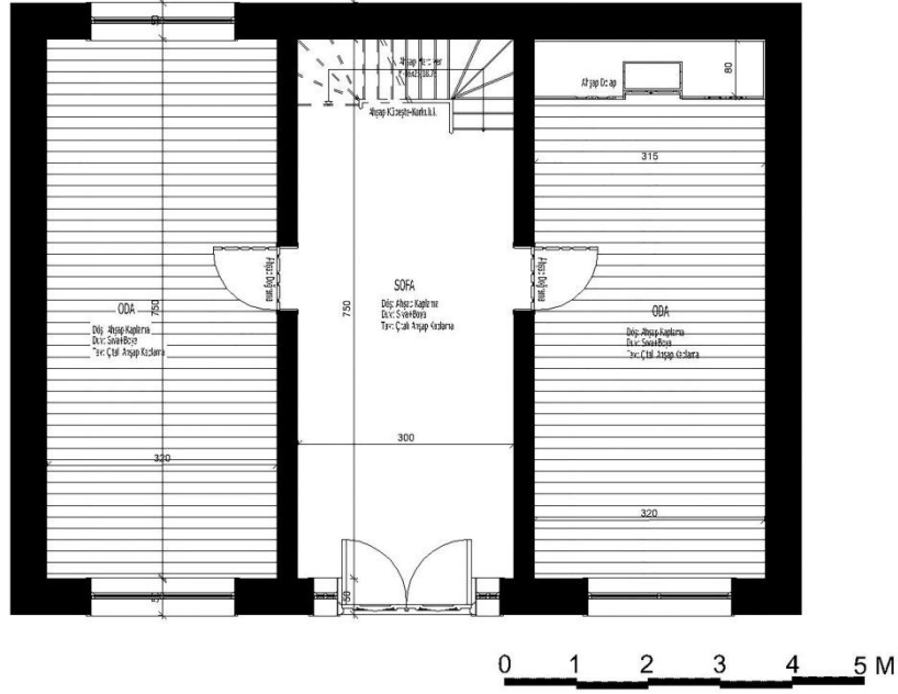
ZEMİN KAT PLANI