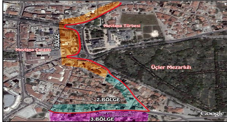
Şekil 2. Konya Mevlana ve Çevresi Kentsel Sit Alanı (Google Earth)

Yapının Yeri: Karatay İlçesi Aziziye Mahallesi, Mengüç Caddesi No: 49 'te, 42 Ada, 76 Parsel üzerinde bulunur. Konya kentsel sit alanı içerisinde 3. bölgede yer almaktadır (Şekil 2).