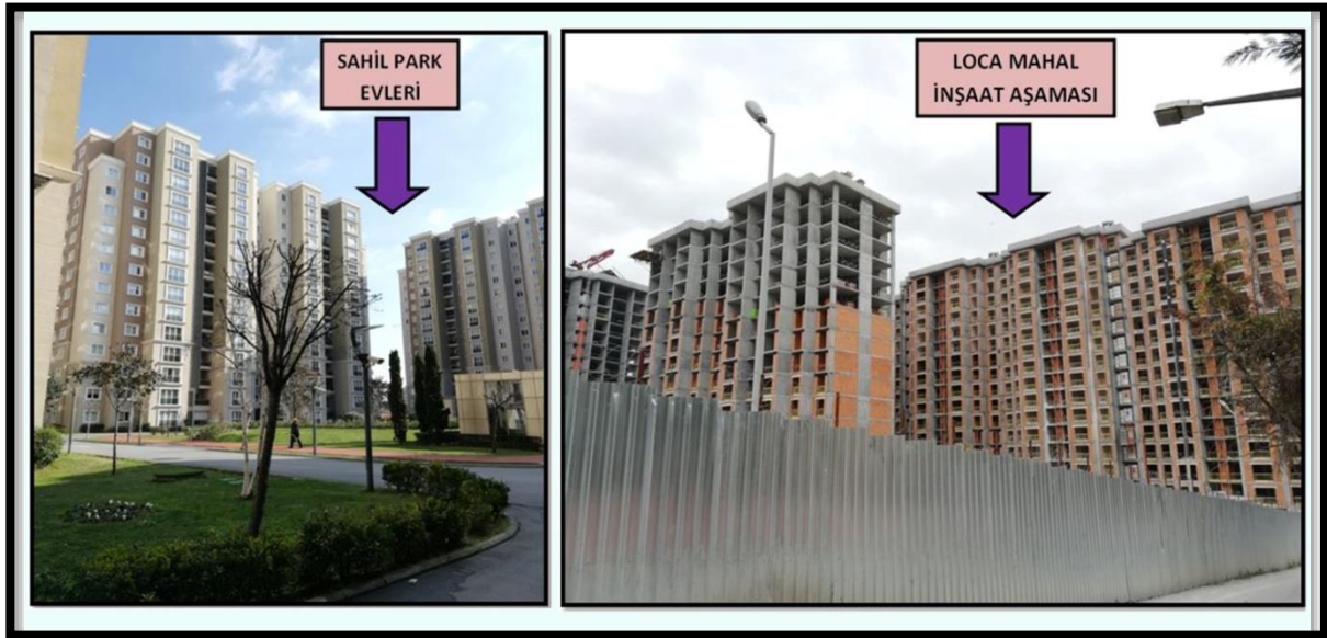
Şekil 5. Dönüşüm alanının görüntüsü

Proje iki aşamadan oluşmaktadır. Birinci aşamada Spor Sahası alanına Sahil Park evlerinin yapılmasıyla başlanmış ve tamamen bitirilmiştir. Birinci aşaması gerçekleştirilmiş, ikinci aşaması ise yıkım işlemleri tamamlanmış inşaat aşaması devam etmektedir. İnşaatı devam eden sahada oturan kişilerin bazıları Sahil Park Evlerinde konut sahibi olarak veya kira yardımı alarak yaşamlarına devam etmekte, ikinci etabın bulunduğu alanda yaşayanların bazıları ise dönüşüm süreci için yakın çevrede geçici olarak kiralık başka konutlara yerleştirilmiştir. İkinci etabın gerçekleştirileceği alanda yaşayanlara ulaşabilmek ve derinlemesine görüşmeleri gerçekleştirebilmek için projeyi gerçekleştiren KİPTAŞ (İstanbul Büyükşehir Belediyesi'ne bağlı Konut İmar Plan Sanayi ve Ticaret Anonim Şirketi) ile iletişime geçilmiştir. Elde edilen bilgiler çerçevesinde 2019 yılı ocak